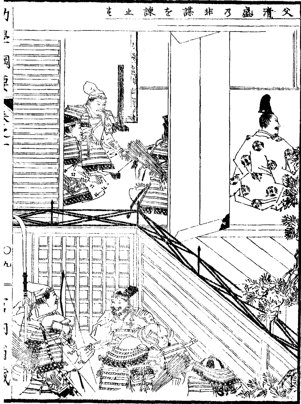
父清盛乃非謀を諫止