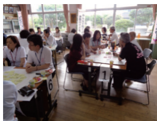
写真 2 熟議の様子

研究者が本熟議のねらいに関して作成したスライド資料を基に話題提起を行った後、前回熟議成果物を視覚化した資料を基に内容を深化・付加する方向性で同テーマで進行した。