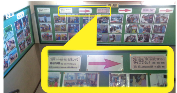
写真5 カリキュラムの視覚化（5年生の学年掲示板）

カリキュラム実施の進捗及び成果確認、来年度に向けた継続化を意図して、学年掲示板の整備を行った（写真5）。これは、地域連携・協働カリキュラム推進のための「社会に開かれた隠れた教育課程」 5) の実施である。