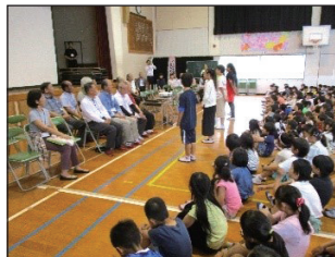
写真3 見守り交流会の様子

情報資源として「伊左座小の子どもと子どもの安全に関わる大人をつなぐ」という思いのもと、6/16の土曜日授業において地区児童会主催による校区安全パトロール隊を中心とした地域関係者らとの交流会を計画・立案し実施した。また、情報資源として「伊左座小の子どもの安全について全体で共有すべき」という意見のもと、交流会において、保護者・地域関係者らによる参観で、校区の危険個所に関する学習を主幹教諭進行により実施された。