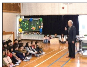
写真4 交流会の様子

事実、この意識を裏付ける行動として、担任は当初の計画を変更し、販売報告や学習の成果発表とを併せ、地域支援者の方との交流会を実施した（写真4）。