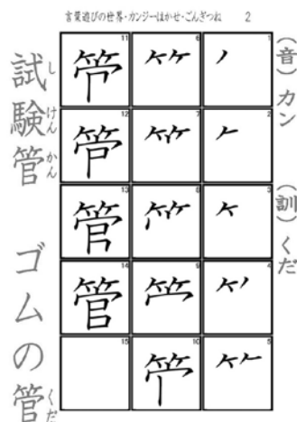
Fig. 2 筆順シートを改良したプリント(1)

プリントの作成方法は次の通りである。まず、児童にとって見やすい文字の大きさや濃さを確認し、筆順シート（中）を「かけるクン」で印刷し