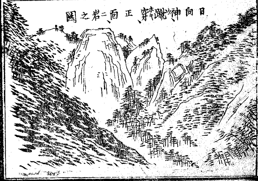
日向神蹴、正、面、二、岩、之、國

諸種ノ物産アリテ、其富他郡ニ冠タリ、但山間ノ 地、舟車ノ便ヲ欠ノミ、 御前嶽ハ、郡ノ東ニ聳エ、豊後ノ日田郡ニ跨リ、山 勢雄偉ニシテ、國中第一ノ高山タリ、東南ニ射干、 黒塚三國名 モリ 等ノ諸山アリ、東北ニ、平野麻生ノ 二嶽アリ、雌雄嶽、飛形山ハ、西南ニアリ、而シテ 日向神岩山ハ、諸山ノ中ニ位シ、矢部河其中央ヲ 流レ、巨巖怪石、兩崖ニ駢立シ、奇絶名狀スヘカラ ス、一州ノ勝區タリ、 矢部川ハ、水源ニアリ、二ハ、御前嶽ヨリ出、一ハ、三