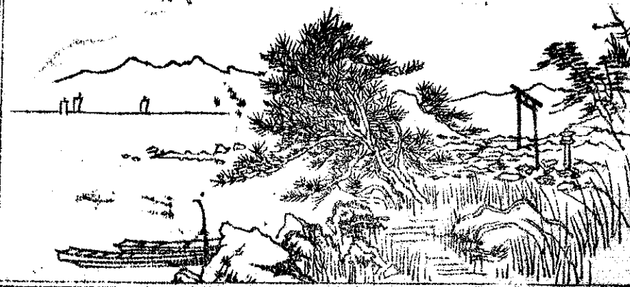
岬村 海邊 之 図

西ハ海ニ臨ミ北ハ山門郡ノ平野ニ連ル其間東白銀村等ノ山脈一帯西走シテ岬角海中ニ突出シ其左右川流數條アリテ灌漑運輸ノ便アリ土質亦概肥沃ナリ