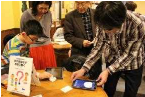
写真 4. スマホ顕微鏡を用いたゾウリムシ観察の様子

顕微鏡で観察を行った後は、「質問・おしゃべり」の時間として、参加者から細胞についての質問に「細胞博士」が答える時間とした。参加者からは「さいぼうのかたちは、ほかにも（頬細胞、ゾウリムシ以外にも）あるんですか」（括弧内は筆者が加筆）「体がかたい人は細胞もかたいのですか」「ゾウリムシを見たときにまわりであってつぶ上のはさいぼうですか？」（原文のまま）など多くの質問が寄せられた。