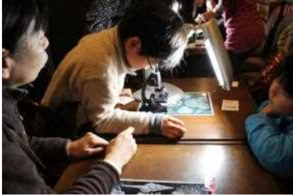
写真 3. 光学顕微鏡を用いた頬細胞観察の様子