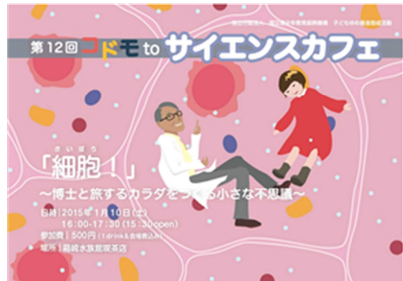
写真 2. コドモ to サイエンスカフェ第 12 回のフライヤー

本稿で取り上げる「コドモ to サイエンスカフェ」について概説する。コドモ to サイエンスカフェは、2011 年度に筆者の坂倉らが立ち上げた学生団体「コネット（子どもと科学を結ぶプロジェクト）」（2010～2011 年度）が「大人も子どもも一緒に楽しめるサイエンスイベントをしたい」という思いから子どもゆめ基金助成事業の助成を得て始めた取組みである。2012 年度以降は主催を CLCworks (2) に移しながらも年間 2～3 回のペースで開催をし、2015 年 9 月現在第 14 回目を迎える。